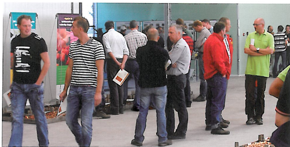
Tijdens de open middagen is een groot aantal bedrijven aanwezig om u te informeren over de laatste stand van zaken rond bolontsmetting

Proeftuin Zwaagdijk organiseert voor u als bollenteler twee interessante open middagen waarbij u van harte welkom bent op Proeftuin Zwaagdijk op vrijdag 17 september van 13.00 - 17.00 uur. Op woensdag 22 september bent u van 13.00 tot 17.00 van harte welkom op de Floratuin, Rijksweg 85 Julianadorp.