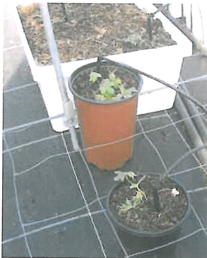
Foto 1: Anjerbak, hoge (1,75 liter) pot en 1 liter, proef 2008/2009