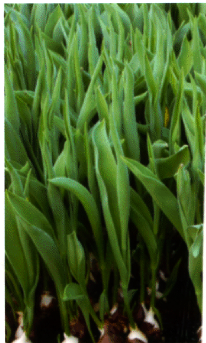
Van 'Leen van der Mark' werden bollen uit de afbroei gebruikt

De proef is in 2003 opgezet met de cultivars 'Ad Rem', 'Yokohama' en 'Leen van der Mark' (uit afbroei) in de bolmaat 11/12. Er werd geplant op de Hydrobak van Bulbfust, de zogenaam-