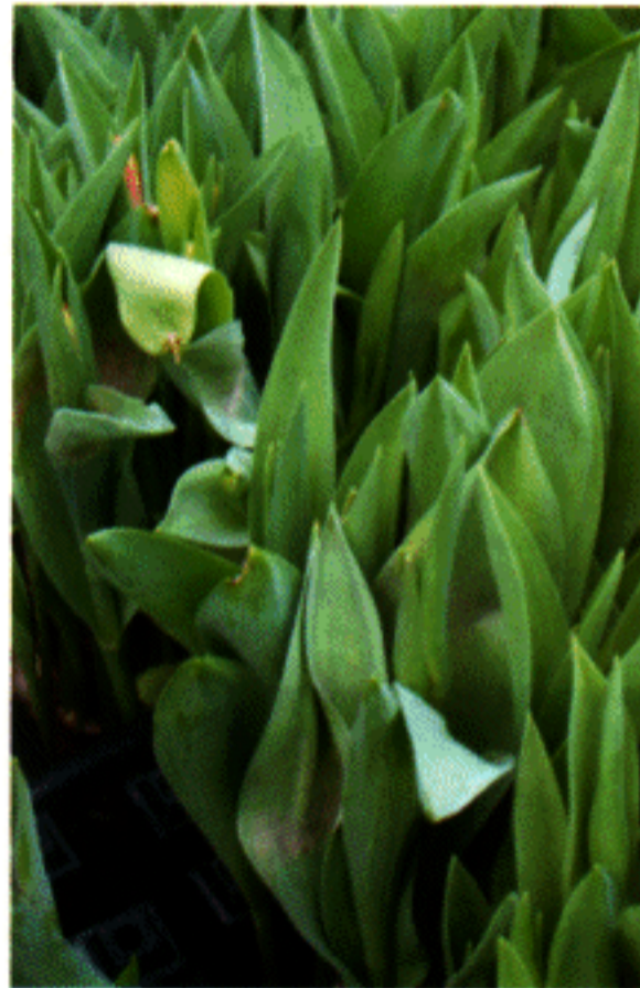
Bladkiepen in Leen van der Mark

Beide jaren werd gewerkt met dikke bollen (12-op) van de twee gevoelige cultivars 'Leen van der Mark' en 'Purple Prince'. Van elke cultivar zijn drie partijen gebruikt van diverse herkomsten. Van de partijen is een drogestofanalyse gemaakt. De verschillende partijen zijn op potgrond en stilstaand water gezet. Op water werd gewerkt met belichting, beluchting in het gewas (luchtslangen) en een combinatie van beide. De belichting was in 2002 circa 6.000 lux met HQIT van 18.00 uur tot 6.00 uur en in 2003 circa 3.000 lux met HQIT lampen van 7.00 tot 19.00 uur. In de proef van 2003 werd daarnaast continu bemest water meegegeven, of alleen bij het afvullen. De bemesting bestond uit Kristalon Rood met kalksalpeter en de EC was 1,5 mS. Beide proeven werden half december ingehaald, de bloei was begin januari.