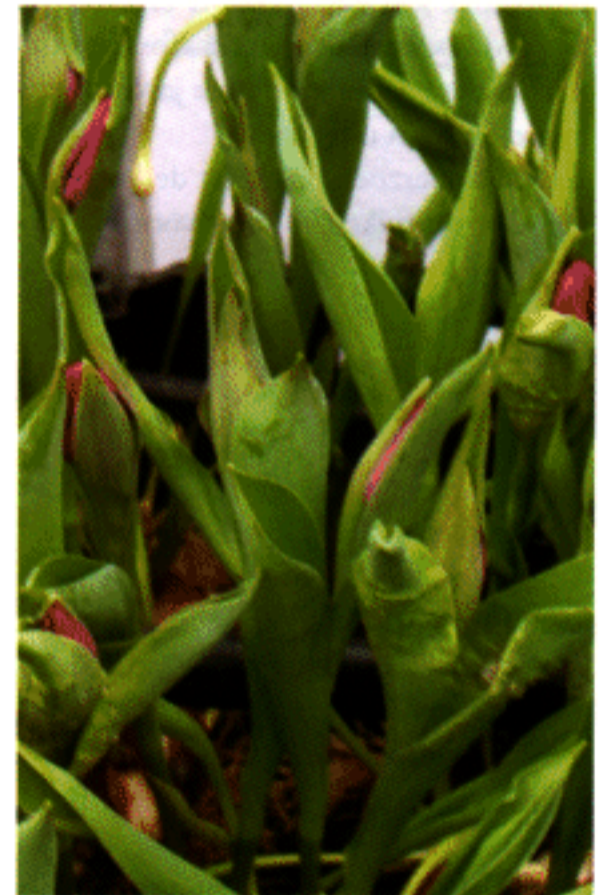
Bladkiepen in Purple Prince