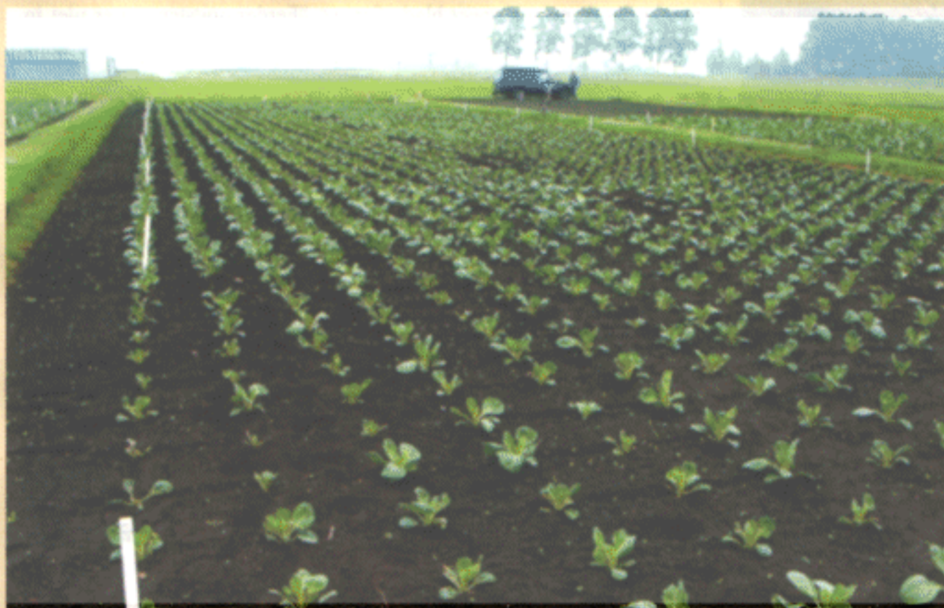
In een proef van proeftuin Zwaagdijk werd duidelijk zichtbaar dat witte kool zwaar wordt aangetast door de aardvlo als niet is bestreden met middelen op basis van imidacloprid.

met de middelen X en Y waren de planten zwaar aangevreten. Hoewel met Gaucho of Admire behandelde koolplanten bij gunstig weer voor de aardvlo licht door deze kever kunnen worden aangevreten, blijven de planten frisgroen. Het verschil met weggevreten, onbehandelde planten is overduidelijk. Kooltelers die te maken hebben gehad met aantastingen door bladluis, melige koolluis of aardvlo in hun gewassen kunnen overwegen voor een van beide middelen te kiezen. Na analyse van de verschillende behandelingen lijken Gaucho en Admire ook te werken tegen de koolgalmug en trips, maar daarover meer in een volgend artikel.